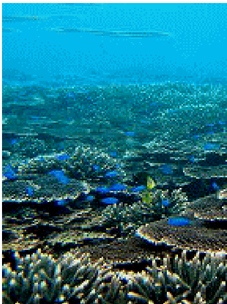
海洋生物の楽園 サンゴ礁

このようにサンゴ礁は海や海洋生物にとって、かけがえのない存在です。サンゴが死滅・減少するということは、海の生態系が変化してしまうほど大きな影響を及ぼすのです。